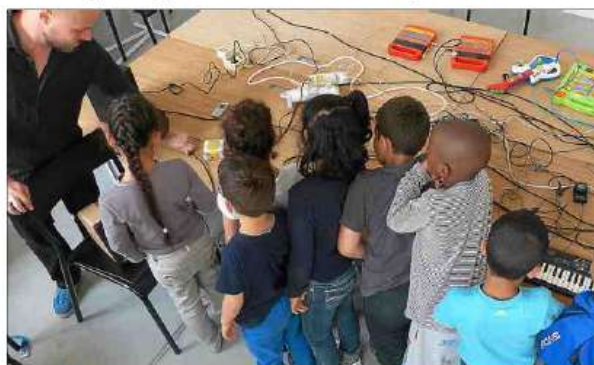
■ Bololipsum accompagne les enfants dans ce voyage...

► Le stage coûte 5 € et s'adresse aux 13-17 ans. Une journée de permanence est prévue vendredi 3 février à la MPT Albertine-Sarrazin (10 h-17 h) pour les inscriptions. Contact : 06 88 21 38 63. www.bololipsum.com .