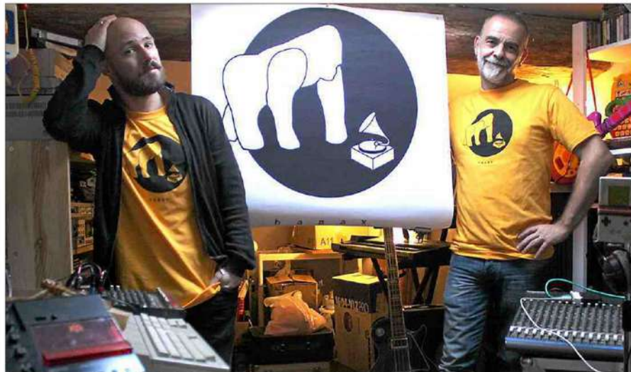
■ Will Wire (droite) et bololipsium (gauche) du label Hapax.

Ensuite par les choix esthétiques et économiques des productions. Hapax ne considère pas le support comme un moyen de diffusion mais comme un véritable objet plastique. « Le but du label est de produire sur des supports standards (vinyle, cassette, CD) mais aussi décalés comme des disquettes, du code informatique imprimé et même des dispositifs élec-